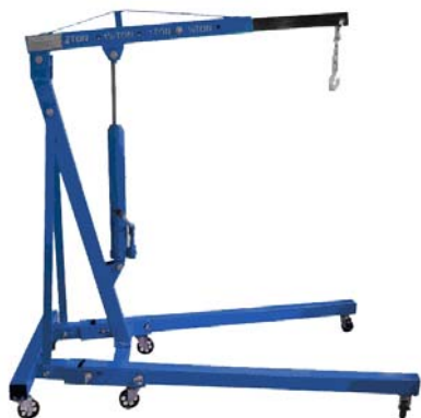
Складные T62201 T62202