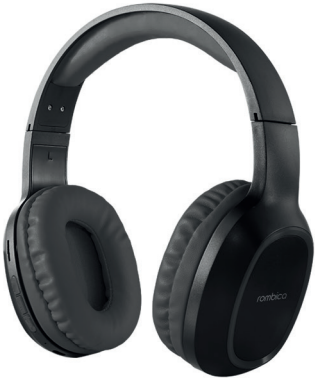
mysound BH-22 Black BH-N027