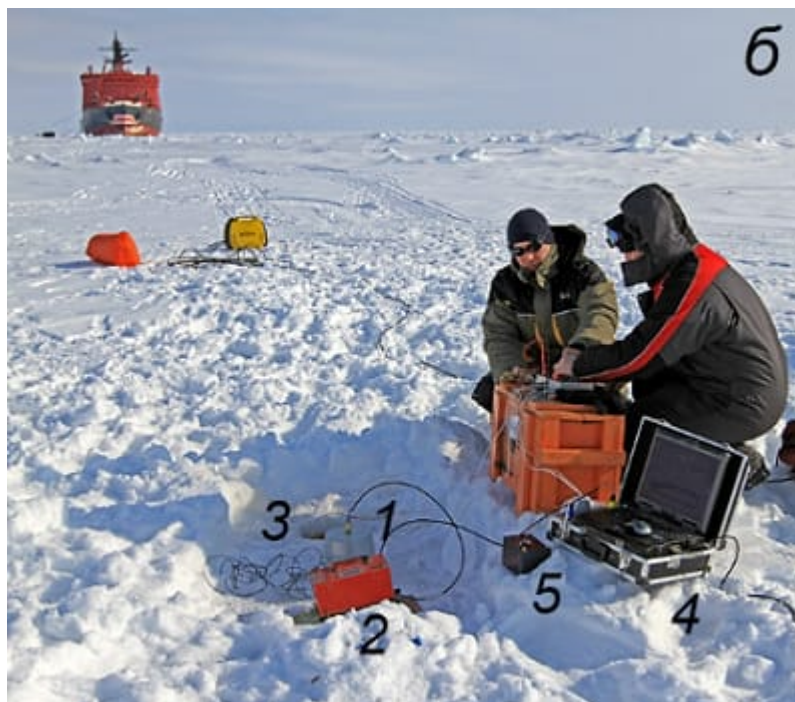
Рис. 1. Схема размещения приборов на ровном льду при экспериментах с движением ледокола «Ямал». Размещение оборудования на пикете: 1 — сейсмометр, 2 — наклономер, 3 — деформометр, 4 — регистратор, 5 — набор аккумуляторов, (радиомодем с антенной за кадром).

В ходе одной из экспедиций система была развернута на льду Карского моря. На рис. 1 представлен рабочий момент экспериментов по регистрации сигналов во льду через радиомодем от движущегося ледокола.