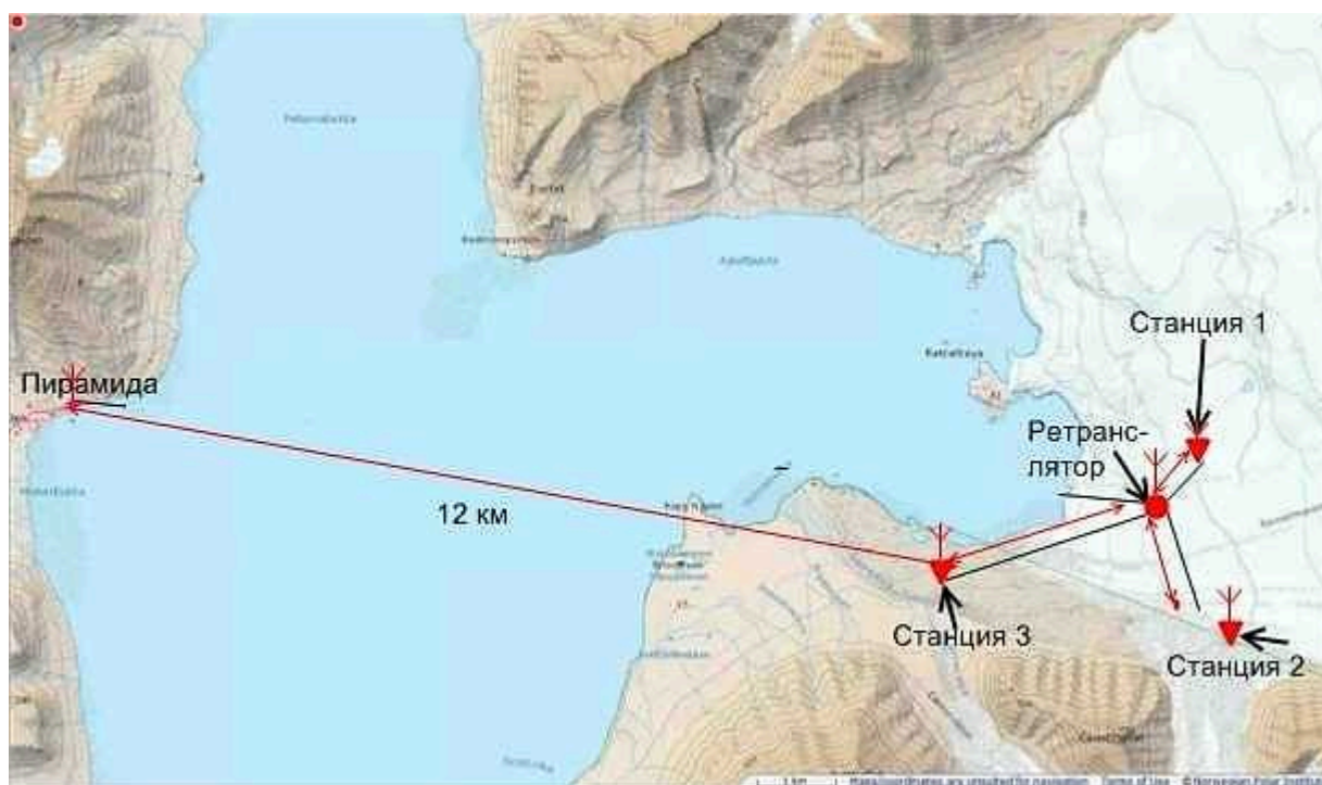
Рис. 2. Общая схема радиосети для инструментального мониторинга состояния ледника Норденшельда — арх.Шпицберген.

Нарушений в работе средств связи и обмена данными в период проведения эксперимента не выявлено.