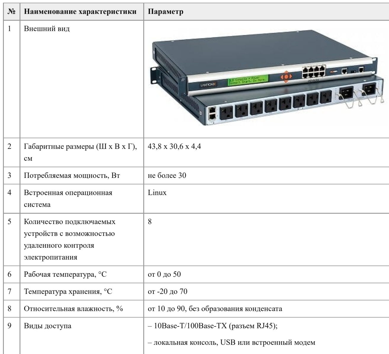
Таблица 1. Технические характеристики консольного сервера Lantronix SLB.

Технические характеристики консольного сервера Lantronix SLB представлены в Таблице 1.