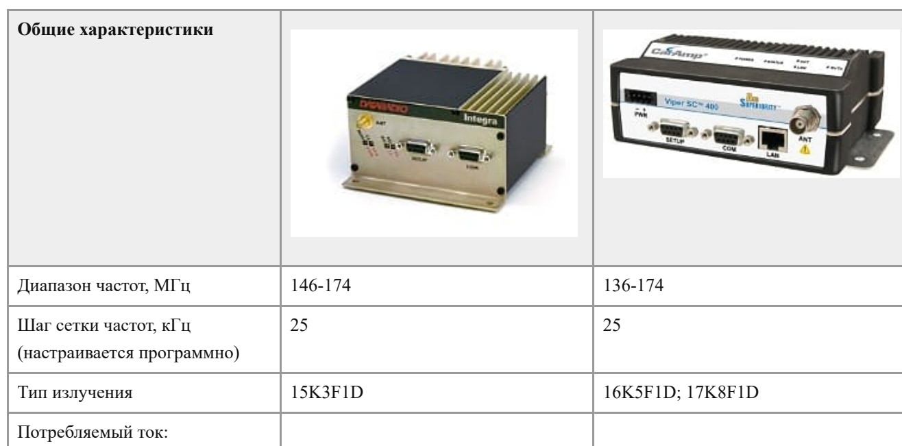
Таблица 1. Сравнительные данные узкополосных радиомодемов Integra-TR и Viper-SC+.

Сравнительные данные применяемых в составе радиосети оповещения о цунами радиомодемов Integra-TR и перспективных радиомодемов Viper-SC+ представлены в Таблице 1.