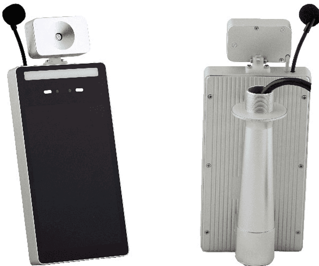
Рис. 1. Прототип терминала «Нейроникс».

В базовый комплект АПК включены функции распознавания лиц заранее известных или зарегистрированных пациентов, дистанционного измерения температуры с высокой точностью и диагностики острых респираторных вирусных инфекций, включая астму, туберкулез, коклюш и COVID-19, в реальном времени.