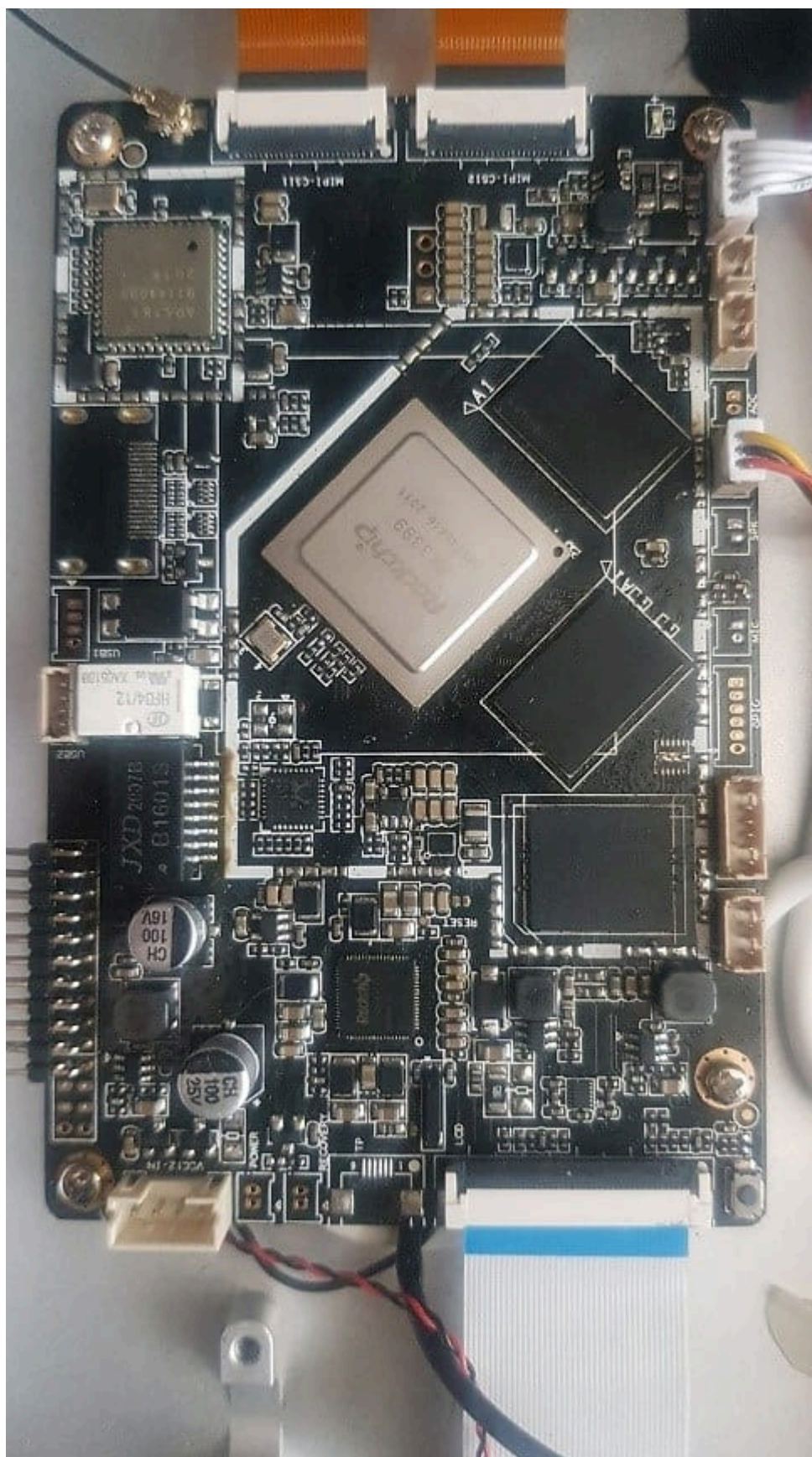
2. Основная печатная плата АПК «Нейроникс Про»

используемый бригадами скорой медицинской помощи в настоящее время. Общий вид основной печатной платы АПК «Нейроникс Про» представлен на рис. 2.